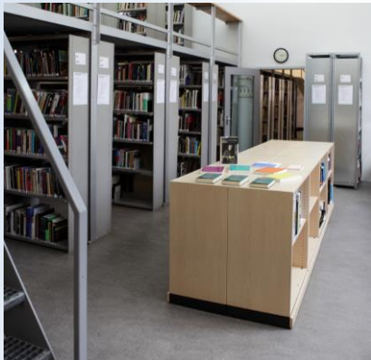
Het Pierre Kemp Lab is de "bouwplaats van het denken." Het biedt onderdak aan een uitgebreide collectie boeken, tijdschriften, audio-visueel materiaal en multimedia.