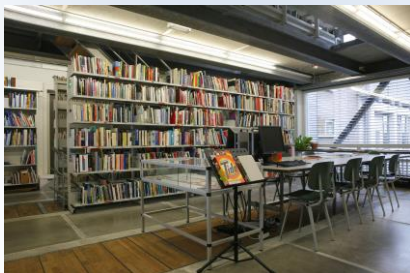
Het aanbod van de Bibliotheek van de Rijksakademie is toegesneden op de ontwikkelingen binnen de kunsten en de interesse- en werkgebieden van de residents.